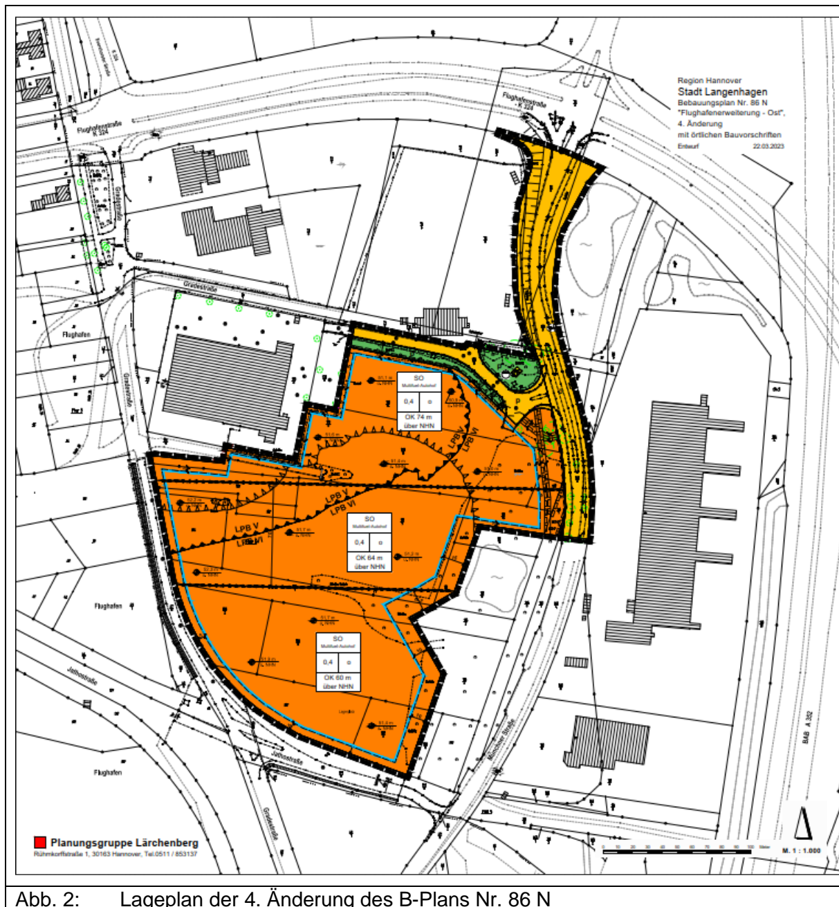
Abb. 2: Lageplan der 4. Änderung des B-Plans Nr. 86 N