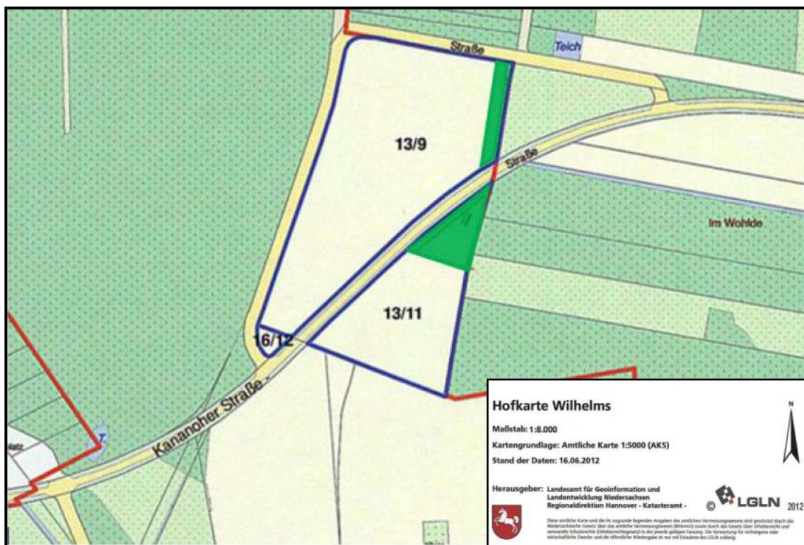
Abb. 4: Lageplan der externen artenschutzrechtlichen Maßnahme in der Gemarkung Kananohe

Folgende Pflanzqualitäten sind zu verwenden: Heister 2x verpflanzt 100/125, Sträucher 2x verpflanzt 60/80. Das Pflanzraster soll 1 m x 1 m betragen. Die Pflanzung von Ersatzbäumen erfolgt mit einem Stammumfang von mindestens 14-16 cm.