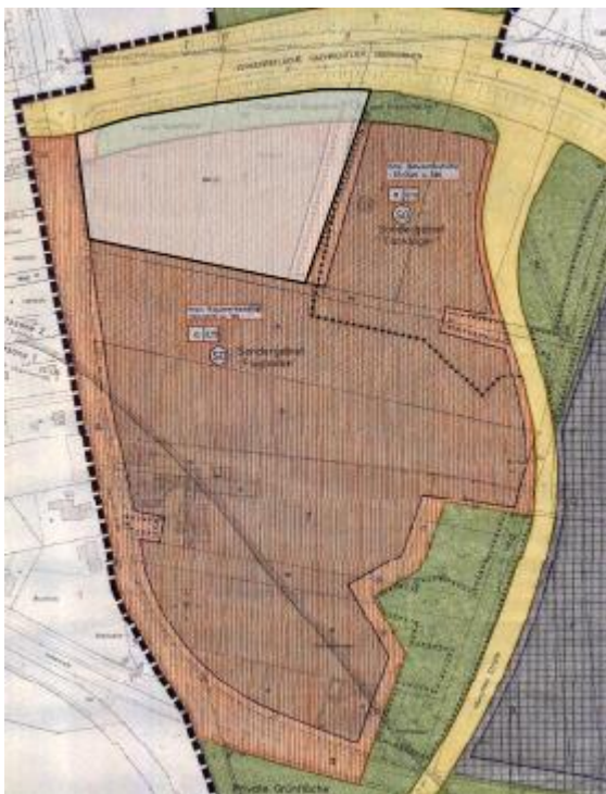
Abb. 3: Geodatenportal der Stadt Langenhagen

Das Schutzgut Pflanzen wird auf Grundlage der Biotoptypen des rechtskräftigen Ursprungs-B-Plans 86 Neuaufstellung von 1997 ermittelt, da die naturschutzrechtliche Eingriffsbewertung vom rechtskräftigen Bestand ausgeht.