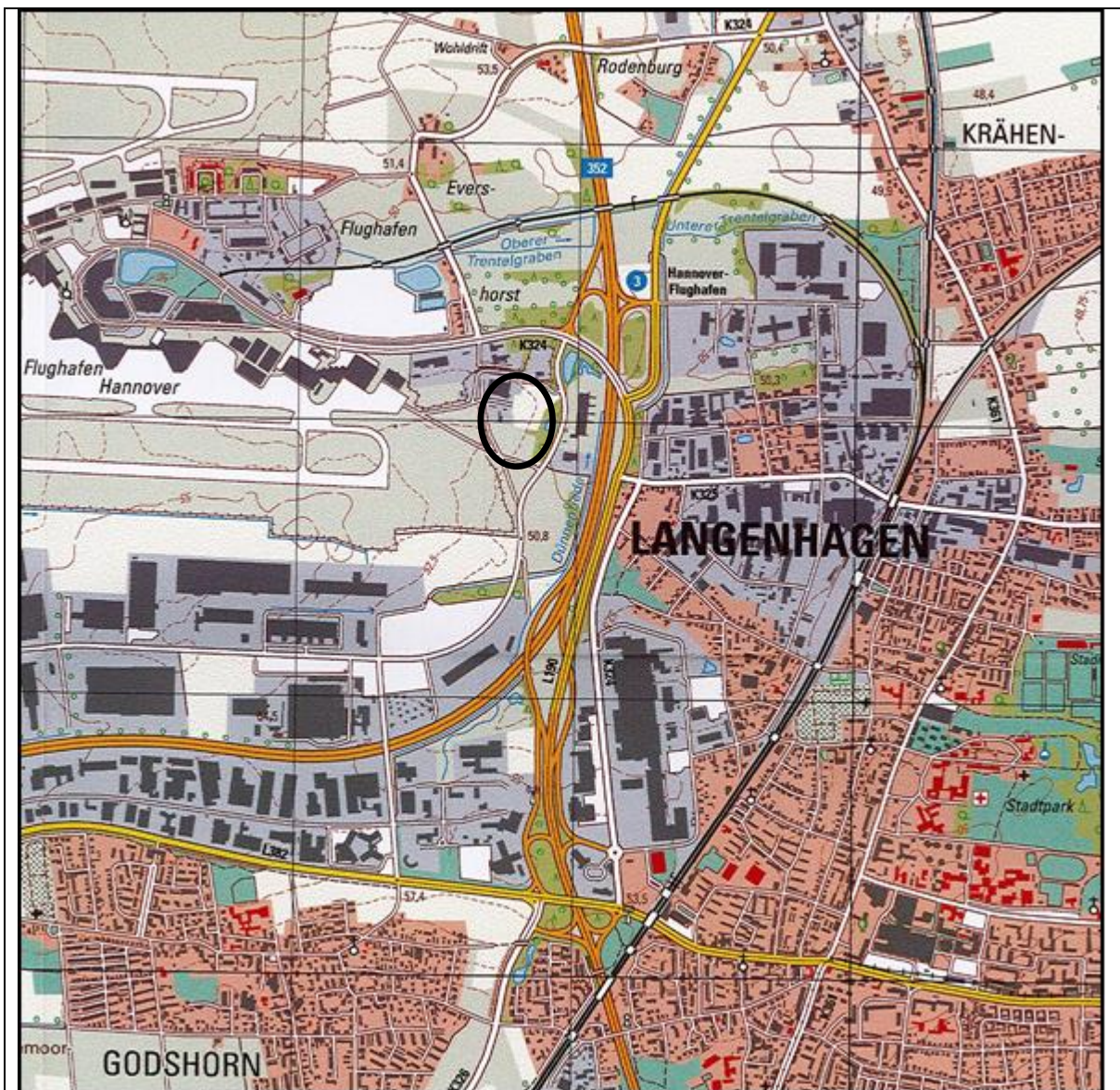
Abb. 1: Übersichtsplan zum B-Plan Nr. 86 N, 4. Änderung (1:25.000 im Original)

Nördlich wird der Änderungsbereich durch die „Flughafenstraße“, südlich durch die „Jathostraße“ und südwestlich durch die „Gradestraße“ begrenzt. Der nordöstliche Bereich der „Münchner Straße“ befindet sich innerhalb des Änderungsbereichs.